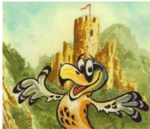
Tinu von Neu- Falkenstein